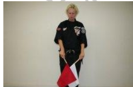
Je hebt een techniek gezien, maar deze trof geen doel