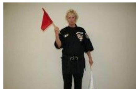
Overmatig contact/diskwalificatie. De vlag van de overtreder in de lucht en grote cirkels draaien.