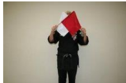
Je hebt geen punt gezien