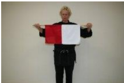
Beide deelnemers scoorden tegelijk een punt.