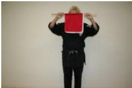
Startpositie wachtend op call van de scheidrechter